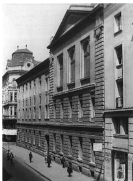
A Teológiai Akadémia a Ráday utca 28. szám alatt az 1930-as években