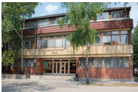
... mai új belsője