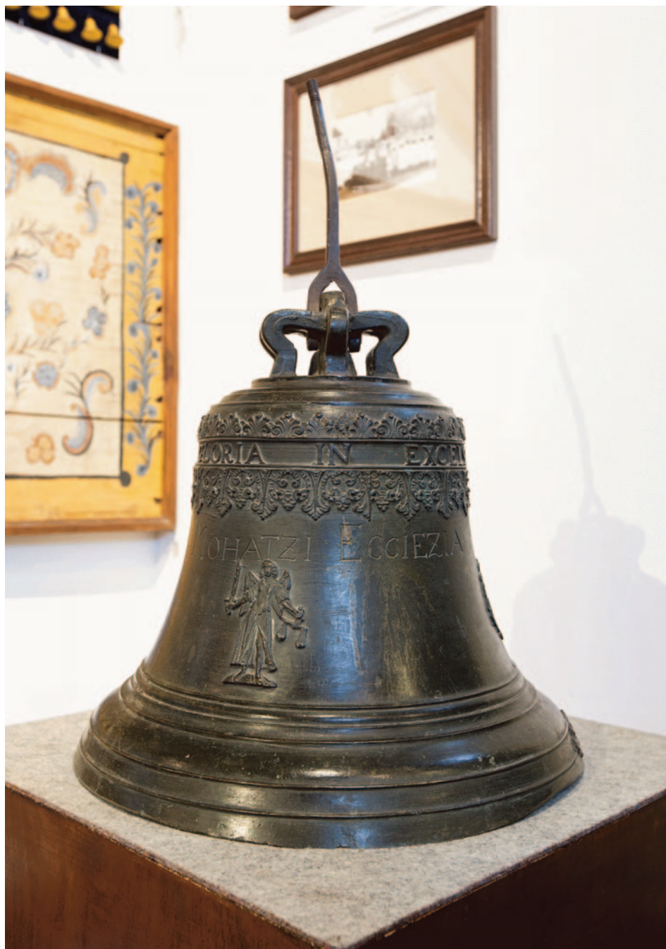
A bidasi barang