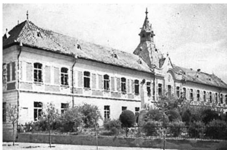
Nagykőrösi Tanítóképző Főiskola korabeli épülete