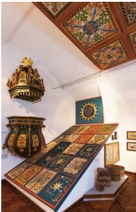
Szőszék, kazettás mennyezet