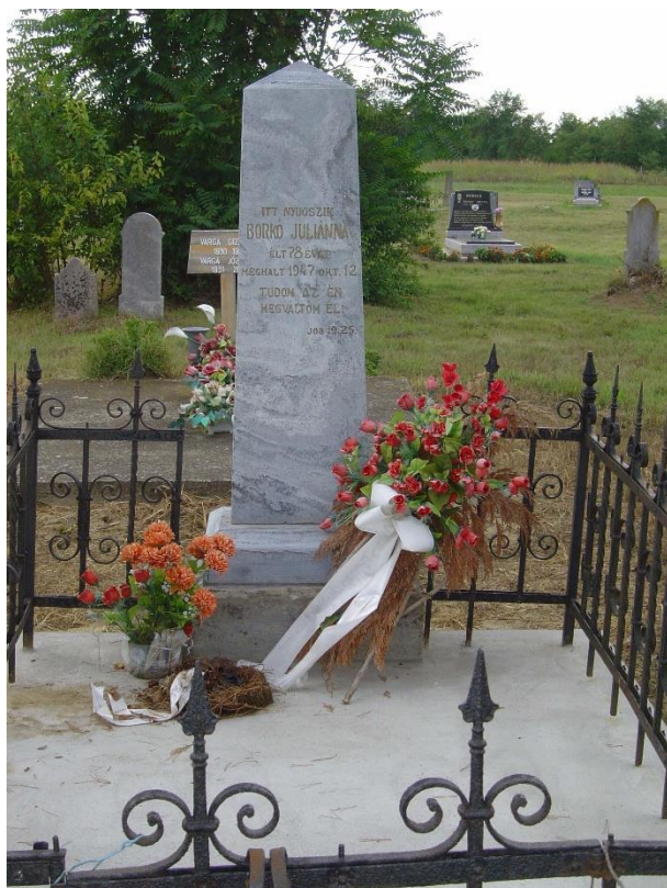
Sírköve a kopácsi temetőben