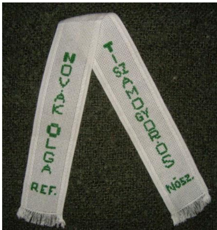
A tiszamogyorósi Novák Olga Református Nőszövetség kitűzője

Van olyan asszonykör, amely tovább viszi örökségét. A tiszamogyorósi áldott tevékenységű Novák Olga Református Nőszövetség első magyar református teológusnőnk nevét viseli.