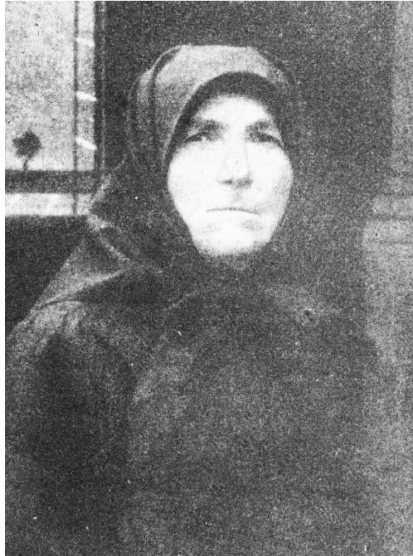
Önéletírásakor készült fényképe

A bevezetőben költői, veretes stílusban kér segítséget „felülről”: „És a te nevedet, Uram, segítségül hívom, mert miként tudom én gyarló, erőtelen létemre rajtam végzett munkádat ismertetni, még inkább a te hatalmas és jóságos kezedet feltüntetni? Oh, bár csak miképpen a parányi harmatcsepp a napot, úgy tudná az én kicsiny életem is visszatükrözni a te képedet, örökkön örökké őrködő gondviselésedet.”