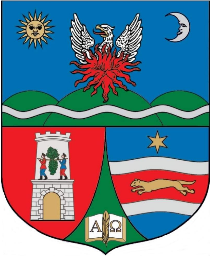
Horvátországi Református Keresztyén Kálvini Egyház címere